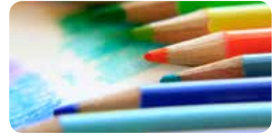
PUZZELEN & KLEUREN Win mooie prijzen