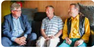
INVLOED Huurders praten mee