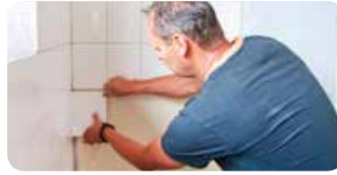
STERK IN DE WIJK Werkplaats Soesterkwartier