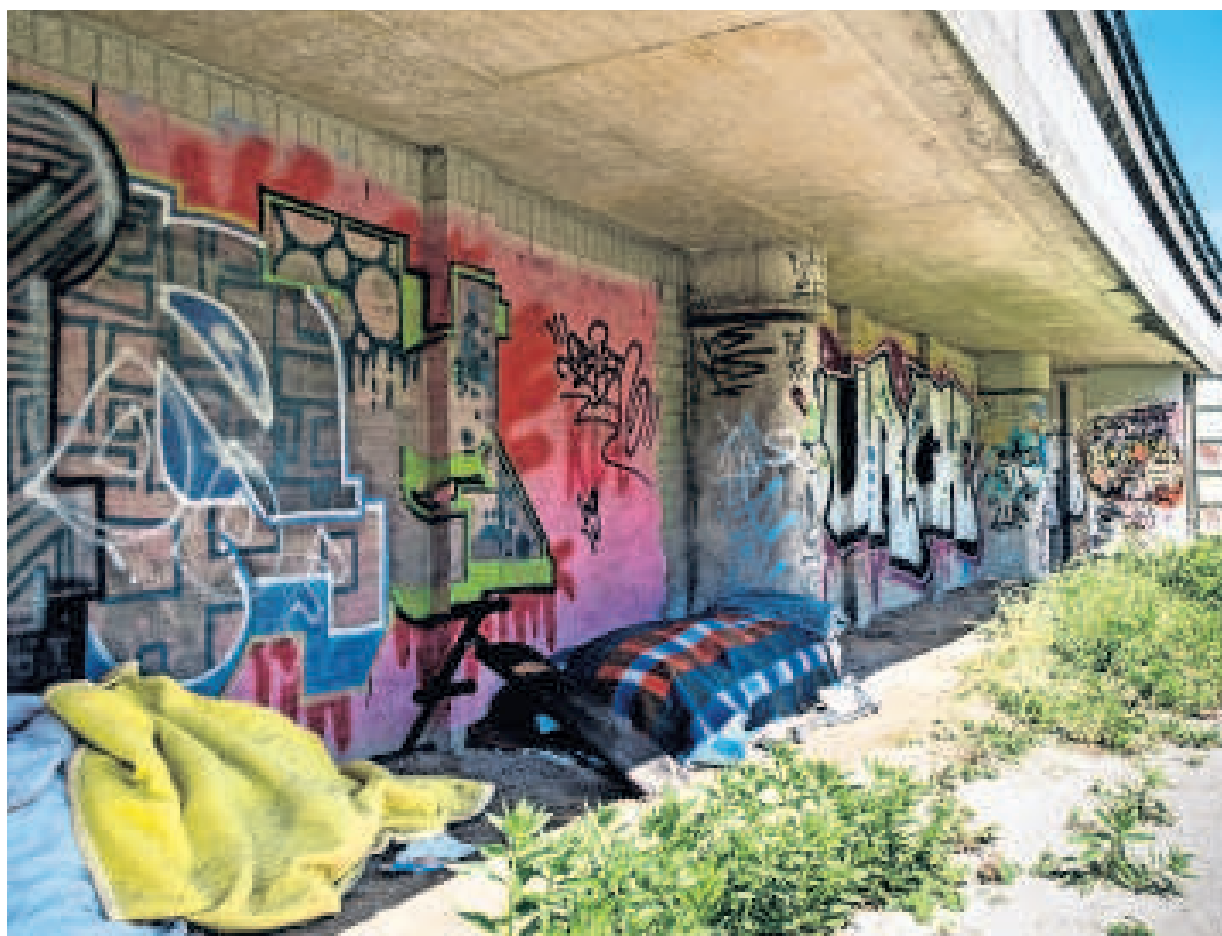
Een geïmproviseerd bed van een dakloze onder een spoorviaduct in Rotterdam.