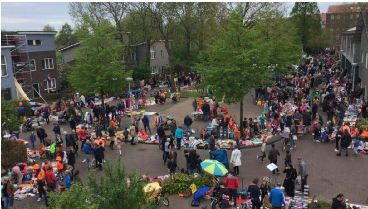
Koningsdag bij 't Groene Sticht 2018

Thema her-ontwikkelen van zorgvoorzieningen