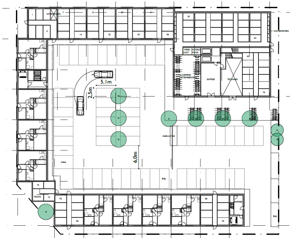
impressie 3: nieuwe situatie bebouwing met parkeren

In principe worden de parkeerplaatsen privé en mogen alleen gebruikt worden voor de nieuwe bewoners van Turkooislaan.