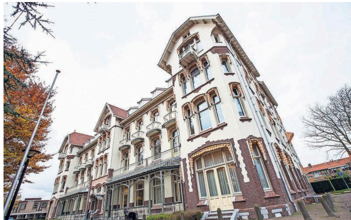
Het gemeentehuis van Oegstgeest.