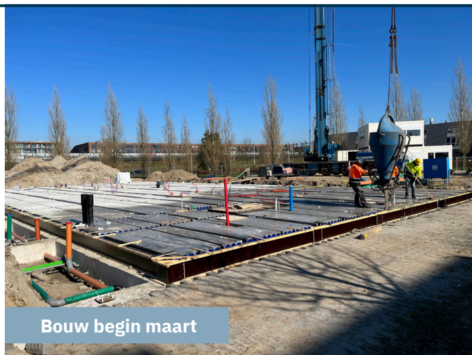
Bouw begin maart