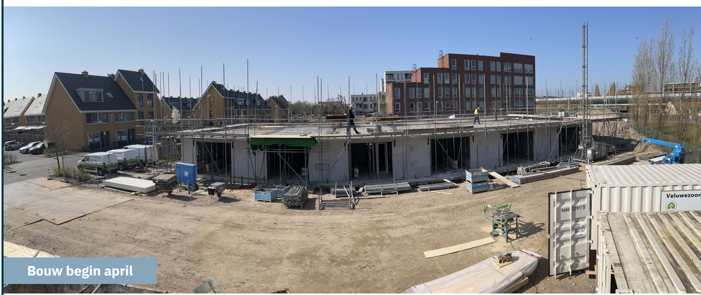
Bouw begin april