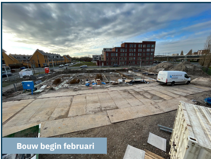
Bouw begin februari