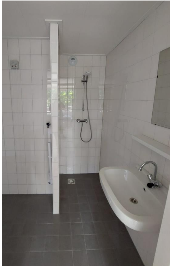
Figuur 2: Voorbeeld van het eindresultaat van een nieuwe badkamer.

Als uw badkamer in aanmerking komt krijgt u nieuwe vloer- en wandtegels, een nieuwe wastafel met een nieuwe kraan, een spiegel en een planchet. De douchehoek krijgt een nieuwe kraan met een verstelbare douchekop op een glijstang. De waterleidingen en afvoer van de badkamer/ toilet werken we weg in de wanden. De wandtegels komen tot aan het plafond. Ook het plafond wordt verlaagd uitgevoerd en wit gesausd.