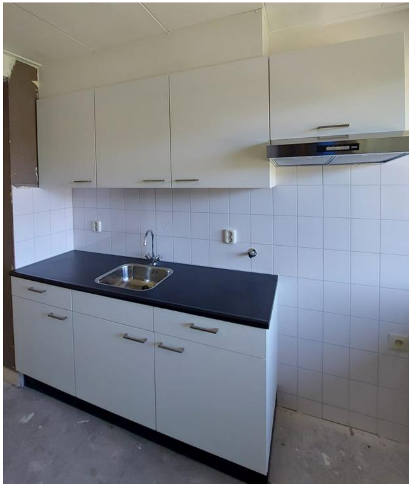
Figuur 3: Voorbeeld van het eindresultaat van een nieuwe keuken.

Komt u in aanmerking voor een nieuwe keuken, dan komen er drie onderkasten, twee bovenkasten, een cv-ketelkast, een afzuigkap, afzuigkapkast en een kunststof aanrechtblad. De muur boven het tegelwerk wordt wit gesausd. De afzuigkap is na het plaatsen uw eigendom en wordt niet door Portaal onderhouden.