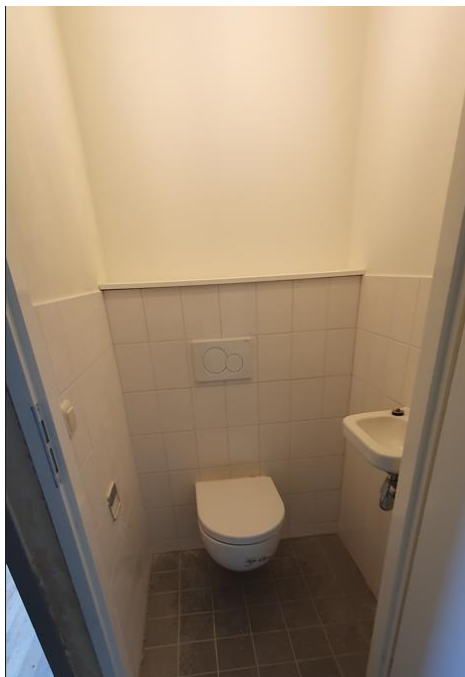
Figuur 1: voorbeeld van het eindresultaat van een nieuw toilet.

Als blijkt dat uw toilet en/of badkamer niet meer aan de eisen voldoet, worden deze vervangen. Dan krijgt u nieuwe vloer- en wandtegels en een hangend toilet. Bij vervanging van het toilet houden we rekening met wat er nu zit. Heeft u nu een verhoogd toilet, dan krijgt u in de nieuwe situatie ook een verhoogd toilet. In het toilet komen de wandtegels tot 1,50 meter boven de afgewerkte vloer. Het plafond wordt verlaagd en zowel het plafond als de wanden worden wit gesausd.