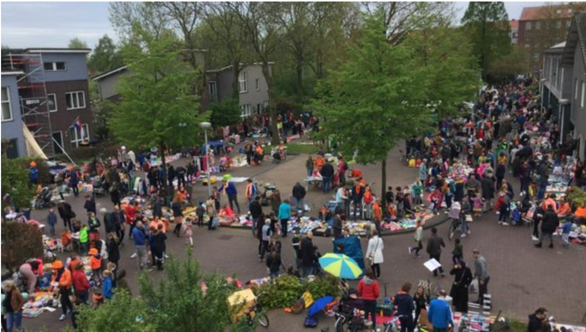
Koningsdag bij 't Groene Sticht 2018