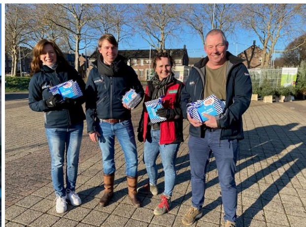
Namens het hele team van Portaal en De Variabele.