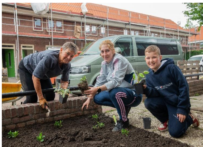
Operatie Steenbreek: Stenen eruit, groen erin!