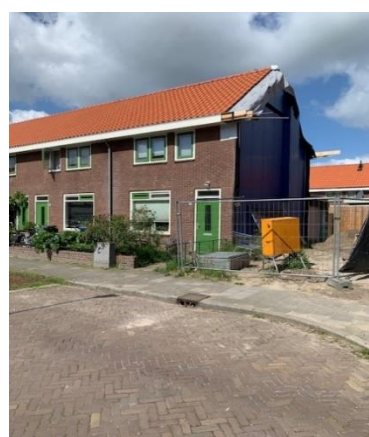
Herbouw Rijnstraat 39 is gestart