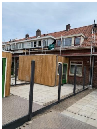
Dakkapellen voor en na de renovatie

In ernstige en dringende situaties kunt u contact opnemen met de storingsdienst van Veeneman Bouw. De storingsdienst is 24 uur per dag bereikbaar voor urgente zaken die met de renovatie te maken hebben. Telefoonnummer 055- 533 39 94. Buiten kantooruren wordt u doorgeschakeld naar de dienstdoende storingsmonteur.