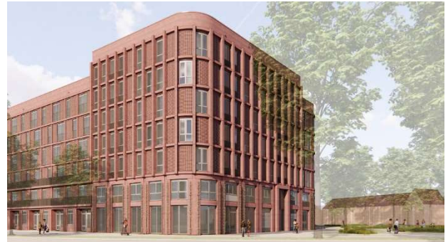
Woningen van Woonin vanaf de Vleutenseweg.