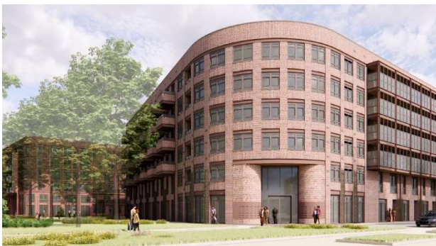
Woningen van Portaal op de kruising bij het spoor.

In de tussentijd wordt het Definitief Ontwerp door Dura Vermeer verder uitgewerkt in uitvoeringstekeningen.