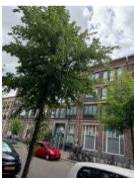
Dit is een uitgave van Portaal.

Spreekuur op ons wijkkantoor (naast Wervershoofstraat, naast nr. 375). Op maandagen van 08.00 tot 09.00 uur en op donderdagen van 15.00 tot 16.00 uur.