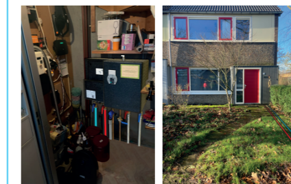
Leidingverloop in de eengezinswoningen