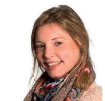
Elles Witsiers Bewonersbegeleider Portaal